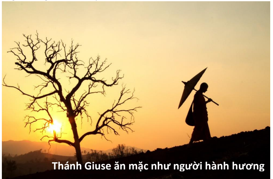
Thánh Giuse ăn mặc như người hành hương

Thánh Giuse vì vậy mà trở thành biểu tượng cho sự tồn tại của Kitô giáo bằng cách trở thành hình ảnh sau này của dòng dõi Áp-ra-ham. Thư đầu tiên của Phê-rô và thư gửi người Hê-bơ-rơ nhấn mạnh điều này. Như Chúa Kitô - các tông đồ nói với chúng ta - anh em những người khách lạ, khách hành hương và những khách trọ (1P1, 1, 17; 2,11; Dt 13, 14). Bởi vì như Thánh Phaolô nói với chúng ta trong thư gửi tín hữu Philipphê, quê hương của chúng ta là ở trên trời (Phi-líp 3:20