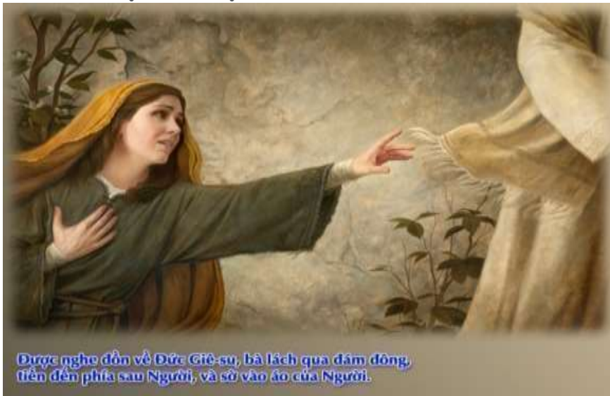
Được nghe đồn về Đức Giê-su, bà lách qua đám đông, tiến đến phía sau Người, và sờ vào áo của Người.

Vậy có một người đàn bà bị bệnh xuất huyết đã mười hai năm. Bà đã chịu cực khổ, tìm thầy chạy thuốc, tiêu hết tiền của mà không thuyên giảm, trái lại bệnh càng tệ hơn. Khi bà nghe nói về Chúa Giêsu, bà đi lẫn trong đám đông đến phía sau Người, chạm đến áo Người, vì bà tự nhủ: “Miễn sao tôi chạm tới áo Người thì tôi sẽ được lành”. Lập tức, huyết cầm lại và bà cảm thấy trong mình đã được khỏi bệnh.